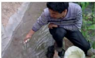
ให้น้ำแบบร่อง