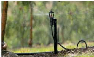
มินิสปริงเคลอร์