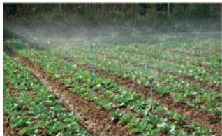
สปริงเคลอร์