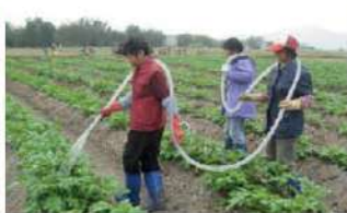
ละลายในถังแล้วรดลงบนพืช