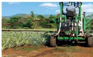
ละลายในถังแล้วพ่นทางใบ

ยาราทเรก้า เหมาะที่จะใช้คู่กับ ยาราทเรก้า แคลซินิก (แคลเซียมไนเตรท ละลายน้ำ 100%)