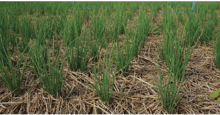
ระยะรองพื้นปลูก