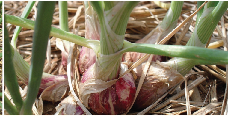
ขยายหัวเพิ่มน้ำหนัก (25-35 วัน)