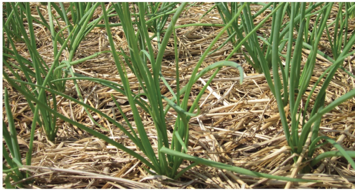
ระยะเร่งการเจริญเติบโต (15-20 วัน)