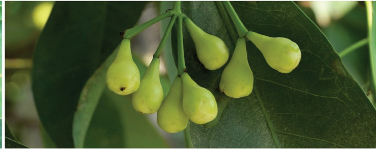
ระยะก่อนติดดอก