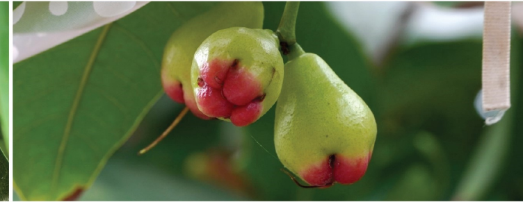
ระยะบำรุงผล