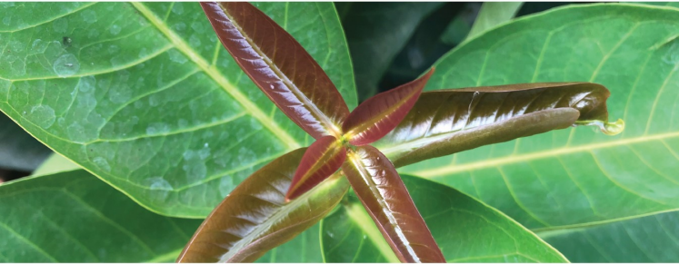
ระยะหลังเก็บเกี่ยวฟื้นฟูสภาพต้น