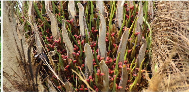
ช่วงกลางฝน