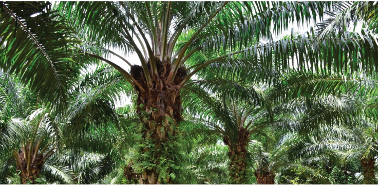
ช่วงต้นฝน