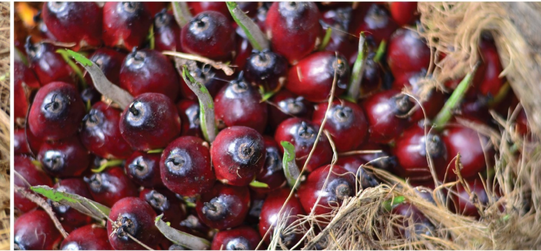
ช่วงปลายฝน