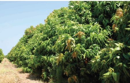
ระยะพุ่มต้น หลังเก็บเกี่ยวผลผลิต