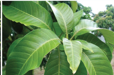
แตกใบชุดที่ 2