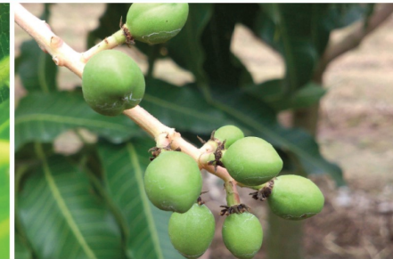
ระยะผลเล็ก