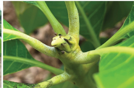
สร้างตาดอก