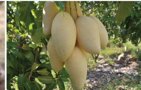
ปรับปรุงคุณภาพผลผลิต