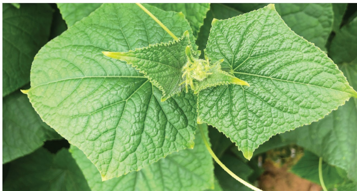
ระยะติดดอก (35-45 วัน)