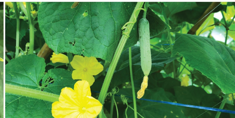
ระยะบำรุงผล