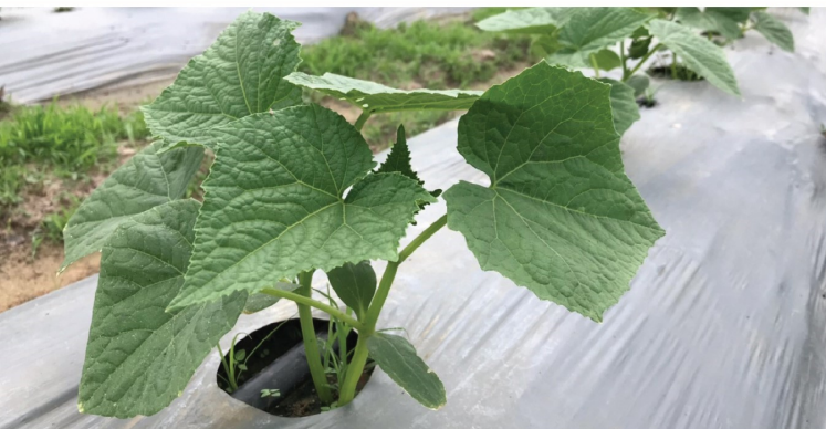
ระยะรองพื้นปลูกจนถึงระยะ บำรุงต้นและใบ (1-14 วัน)